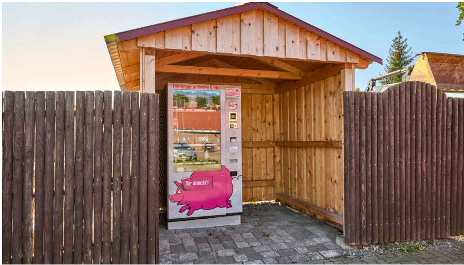
Regiomaat Baddeckenstedt