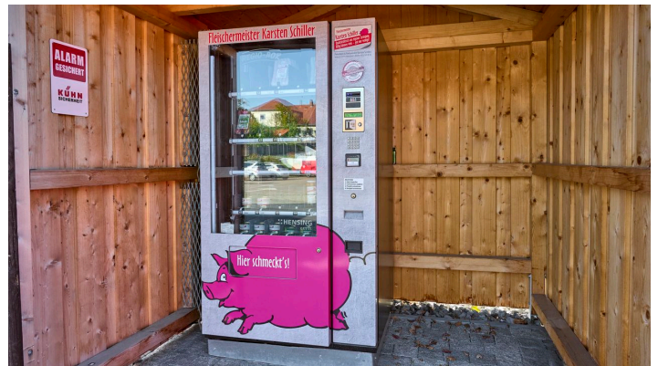
Regiomat Baddeckenstedt