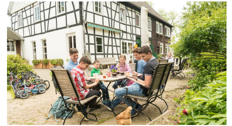
Pause im Hofcafe auf dem Hof zur Hellen im Windrather Tal