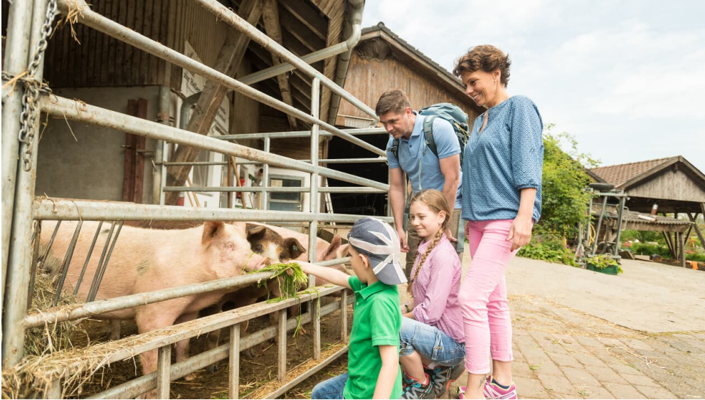
Schweine füttern auf Hof zur Hellen bei Velbert-Nevigis