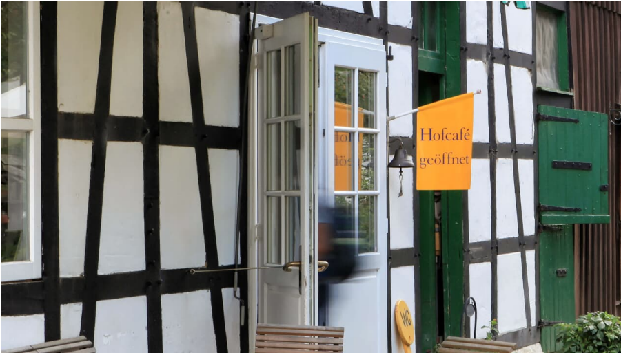
Biohof Hofcafé auf Hof zur Hellen im Windrathener Tal bei Velbert