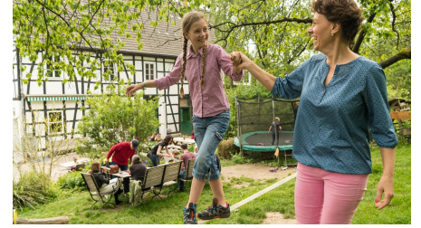
Freizeit auf Hof zur Hellen bei Velbert-Nevigis