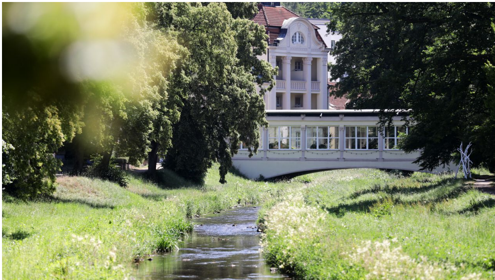
038HR - Bad Salzschlirf - Kurpark.JPG

barrierefrei für Menschen mit Gehbehinderung, barrierefrei für Rollstuhlfahrer, barrierefrei für Menschen mit Sehbehinderung, barrierefrei für blinde Menschen