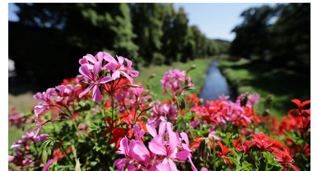
043HR - Bad Salzschlirf - Kurpark.JPG