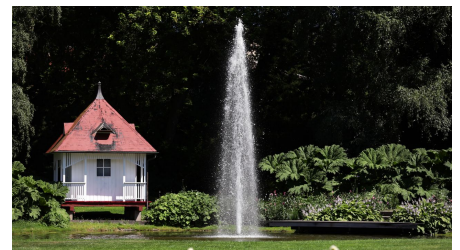
048HR - Bad Salzschlirf - Kurpark Teich.JPG