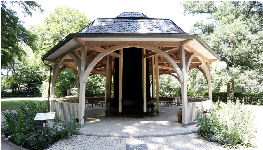
033HR - Bad Salzschlirf - Kurpark Gradierwerk.JPG