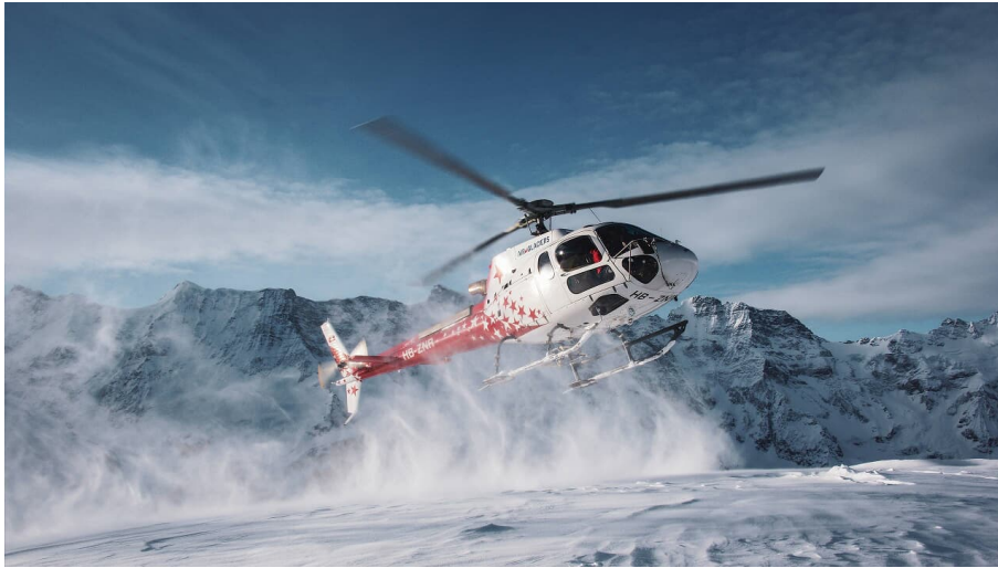
air-glaciers-helikopter-scheee-berge.jpg