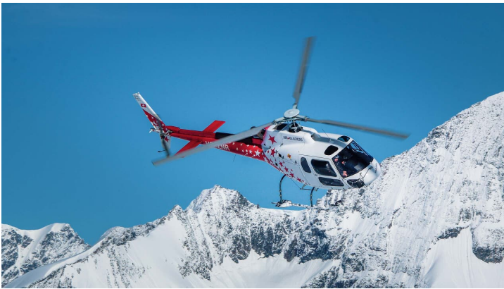
air-glaciers-helikopter-flug-berge-schnee-bild-3.jpg