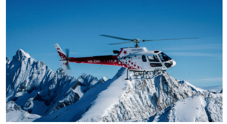
air-glaciers-helikopter-flug-berge-schnee-bild-4.jpg