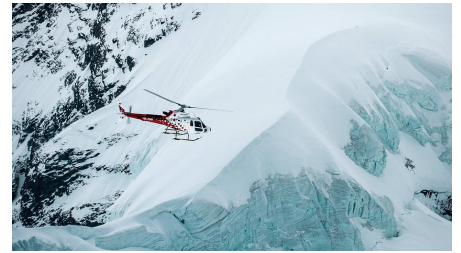
air-glaciers-helikopter-flug-berge-schnee-bild-1.jpg