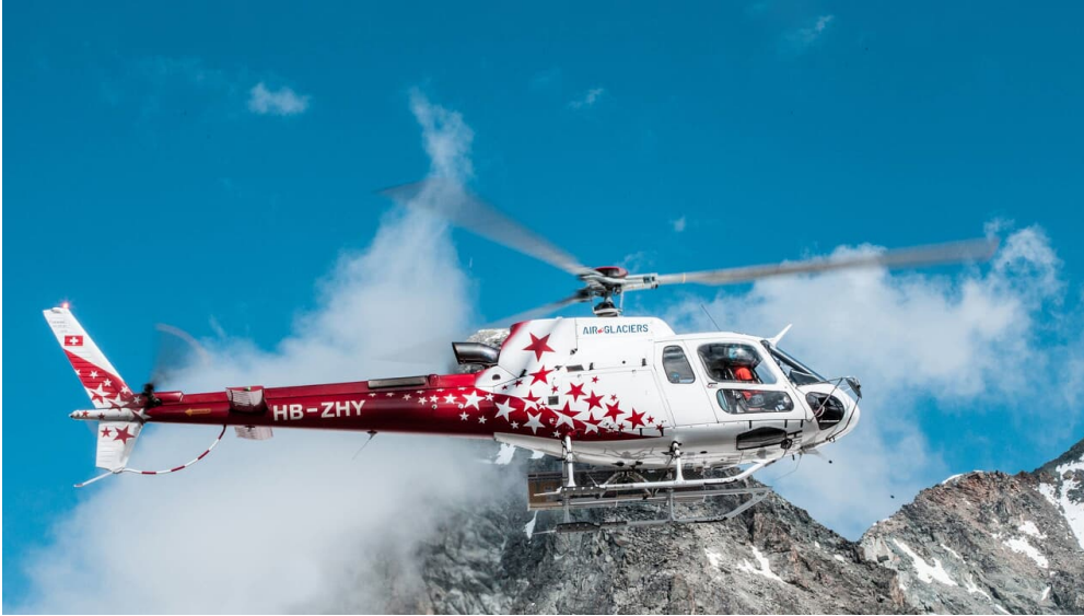
air-glaciers-helikopter-flug-berge-schnee-bild-2.jpg