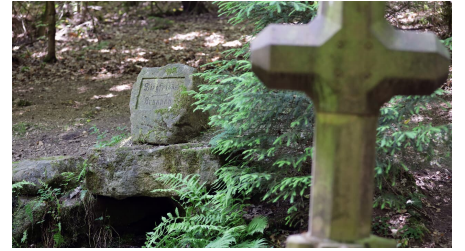
034HR - Grasellenbach - Siegfriedbrunnen.JPG