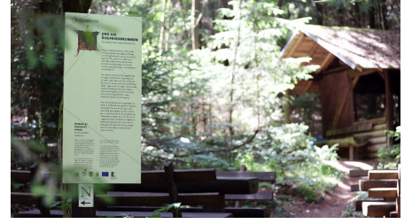
032HR - Grasellenbach - Siegfriedbrunnen Schild.JPG