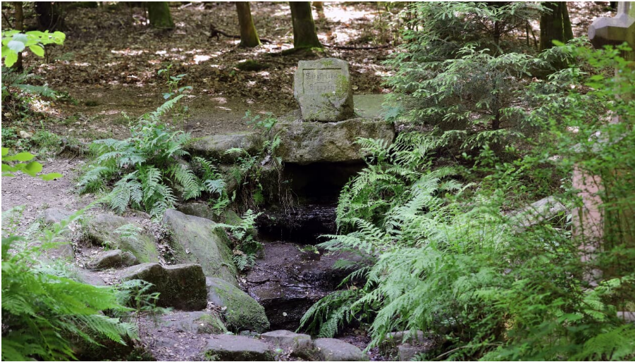
024HR - Grasellenbach - Siegfriedbrunnen.JPG - © Heiko Rhode