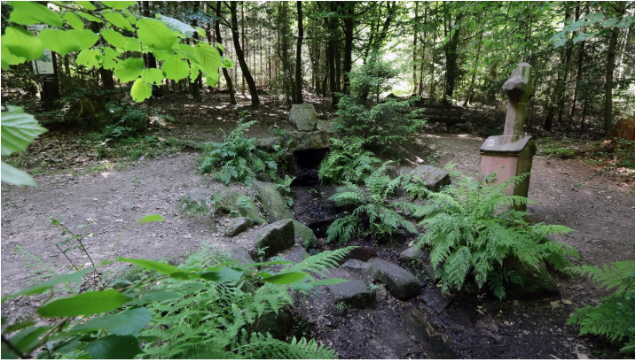
026HR - Grasellenbach - Siegfriedbrunnen.JPG