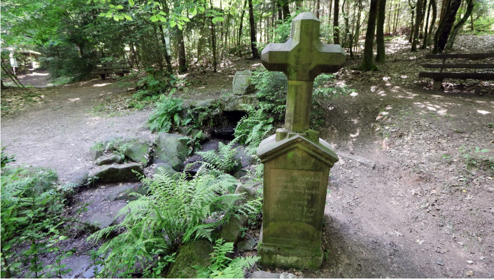
029HR - Grasellenbach - Siegfriedbrunnen.JPG - © Heiko Rhode