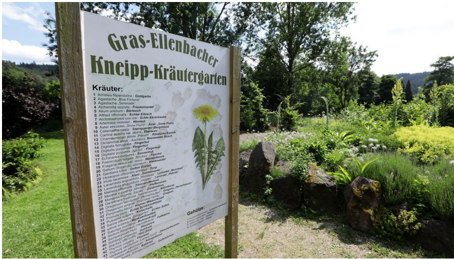
047HR - Grasellenbach - Kneipp-Kräutergarten.JPG