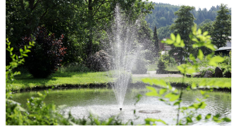
049HR - Grasellenbach - Kurpark.JPG