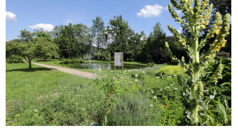
063HR - Grasellenbach - Kurpark.JPG