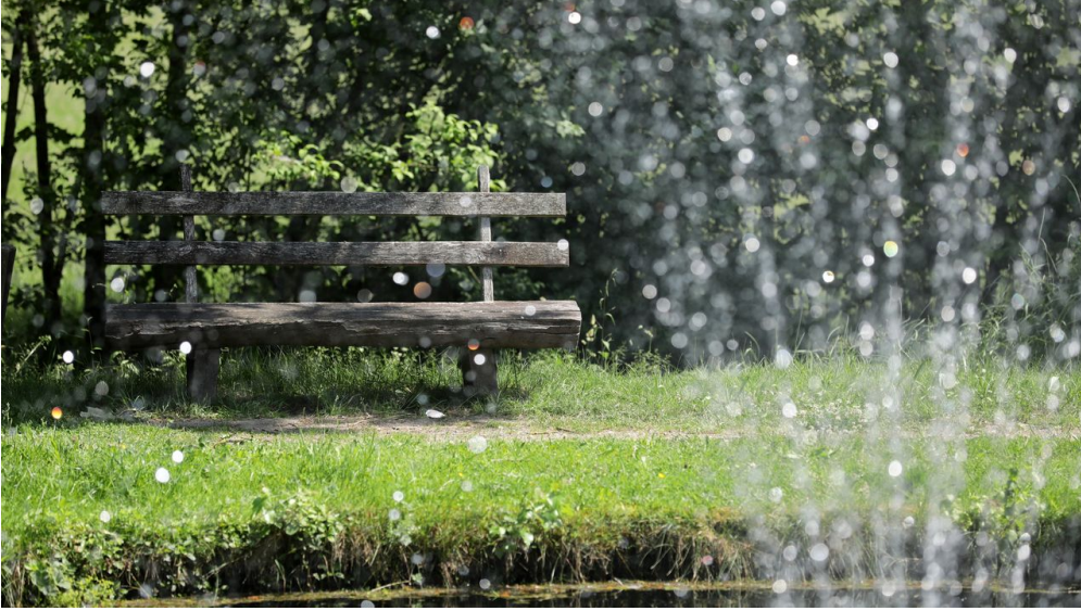
052HR - Grasellenbach - Kurpark.JPG