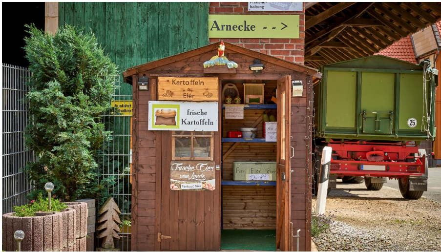
Hofladen Arnecke