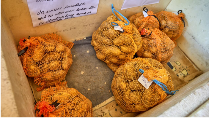
Hofladen Arnecke - © Foto AchimMeurer.com, Achim Meurer