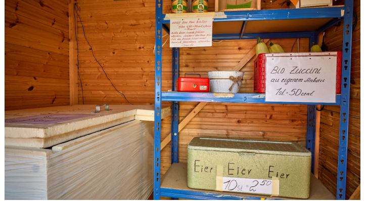
Hofladen Arnecke - © Foto AchimMeurer.com, Achim Meurer