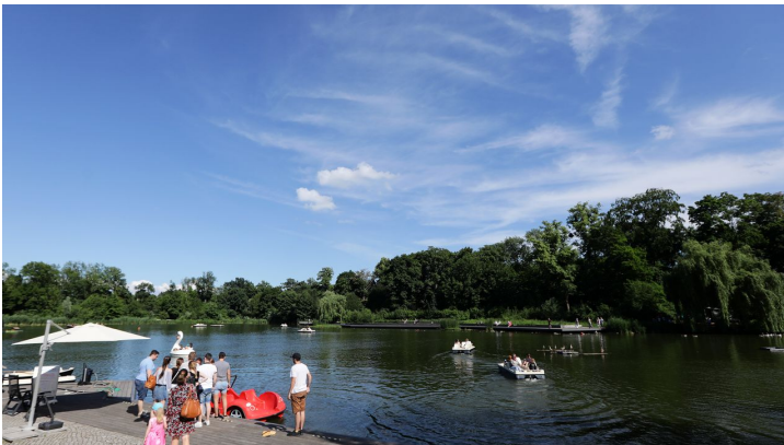
064HR - Bad Nauheim - Kurpark Teich.JPG