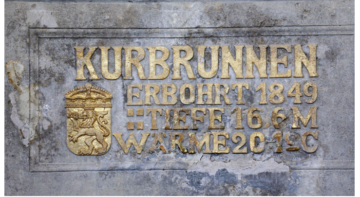
010HR - Bad Nauheim - Trinkkuranlage Kurbrunnen.JPG