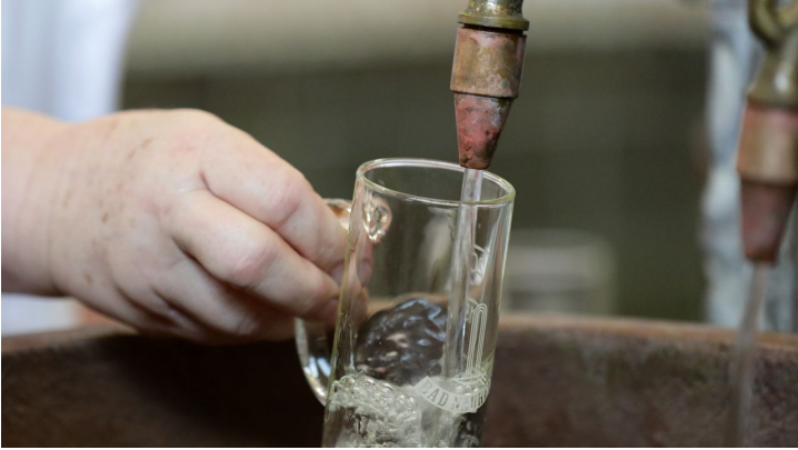
027HR - Bad Nauheim - Trinkkuranlage Kurbrunnen Trinkglas.JPG