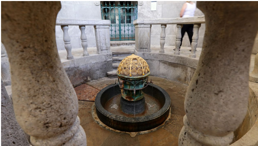
007HR - Bad Nauheim - Trinkuranlage Kurbrunnen.JPG

Der Quellenausschank ist wegen Sanierungsarbeiten längerfristig geschlossen.