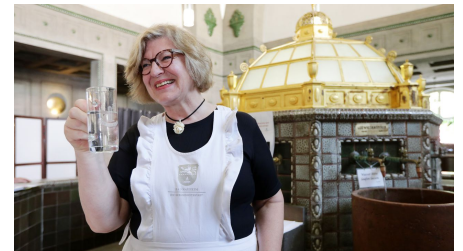
018HR - Bad Nauheim - Trinkuranlage Kurbrunnen Brunnenmädchen.JPG - © Heiko Rhode