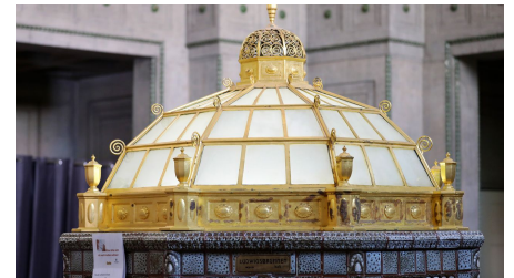
026HR - Bad Nauheim - Trinkuranlage Kurbrunnen Trinkglas.JPG