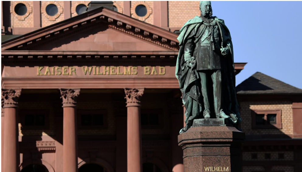
106HR - Bad Homburg - Kaiser-Wilhelms-Bad.JPG

Massage geöffnet: Mo - Fr 8.00 - 22.00 Uhr Sa - So 12.00 - 20.00 Uhr Therapie geöffnet: Mo - Fr 8.00 - 19.00 Uhr Ausnahmen in der Öffnungszeiten: Karfreitag und 24. Dezember - geschlossen 31. Dezember 10.00 - 18.00 Uhr 1. Januar 12.00 - 22.00 Uhr