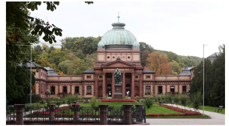
258HR - Bad Homburg - Kaiser Wilhelms Bad Herbst.JPG