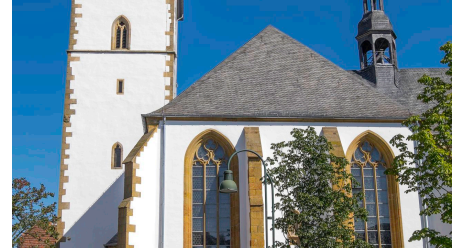
Marienkirche Wiedenbrück