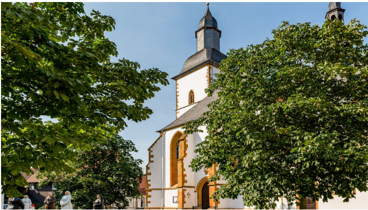
Wiedenbrück-Marienkirche-MWallenfang (1).jpg