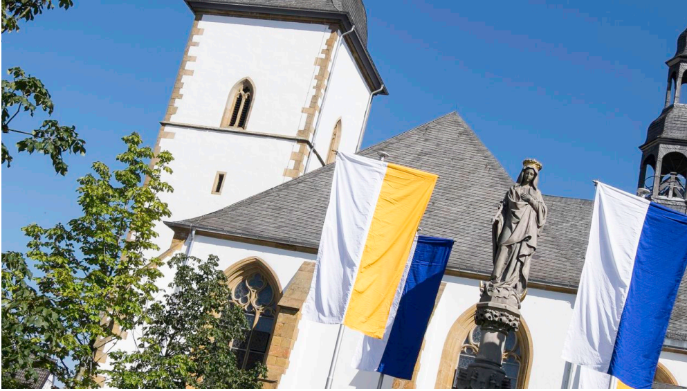
Kloster - Marienkirche