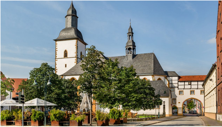
Wiedenbrück-Marienkirche-MWallenfang (2).jpg