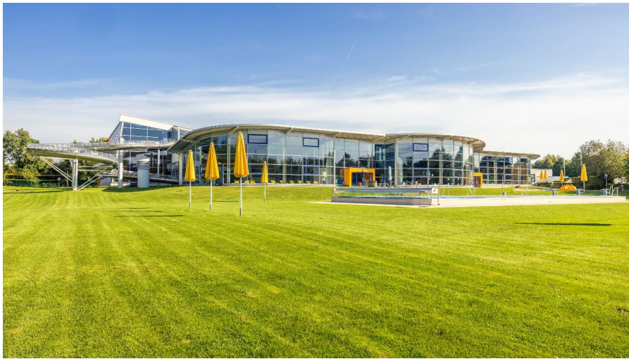
Neanderbad in Erkrath