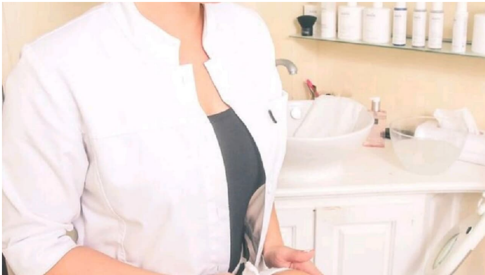
POI_AT-Kosmetik-Horumsiel.jpg - © AT Kosmetik

Behandlungen sind auf Anfrage auch montags und sonntags, sowie nach 18:00 Uhr möglich. Kontaktieren Sie uns gerne.