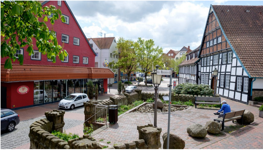
Roseneck