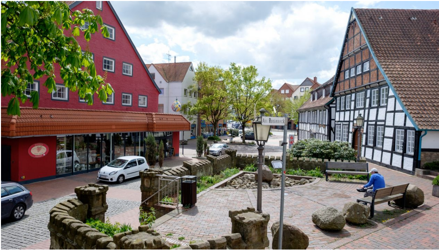
Roseneck