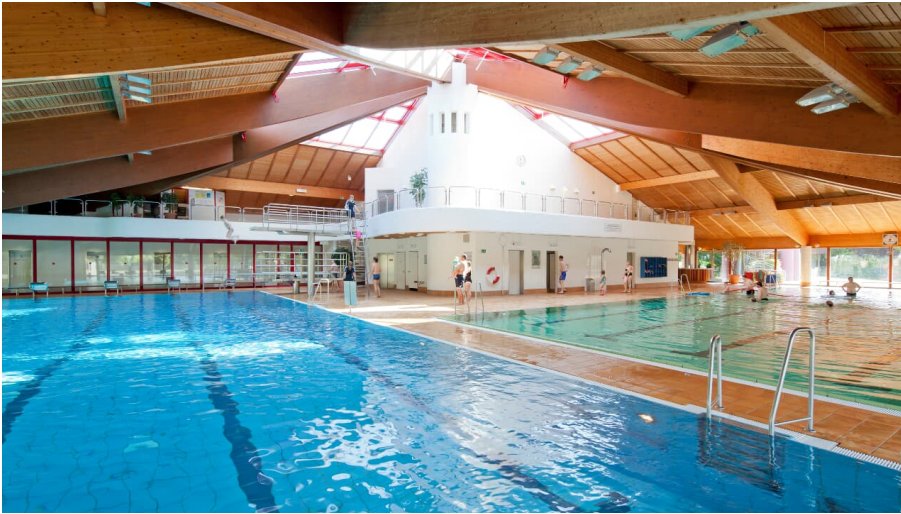
Hildorado Schwimmbad in Hilden