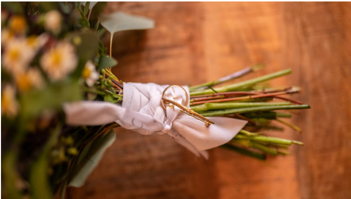
POI_Danila-Schön-Fotografie-Hochzeitsstrauß.jpg - © Danila Schön