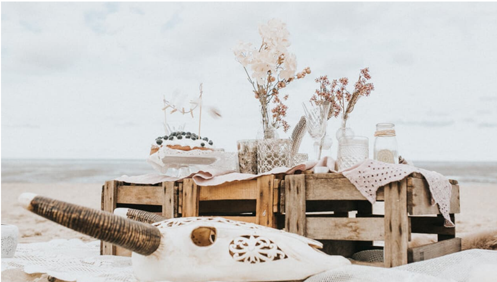
POI_Hochzeitsagentur-Lamour.jpeg - © Hochzeitsagentur L'Amour