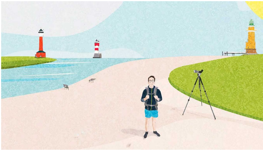
POI_Wattwanderung-mit-Jens.jpg - © Jens Schake