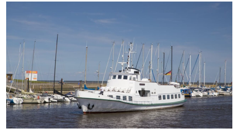
POI_Jens-Albrecht-Seetouristik 4.jpg