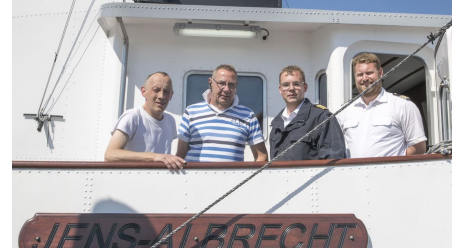
POI_Jens-Albrecht-Seetouristik 3.jpg