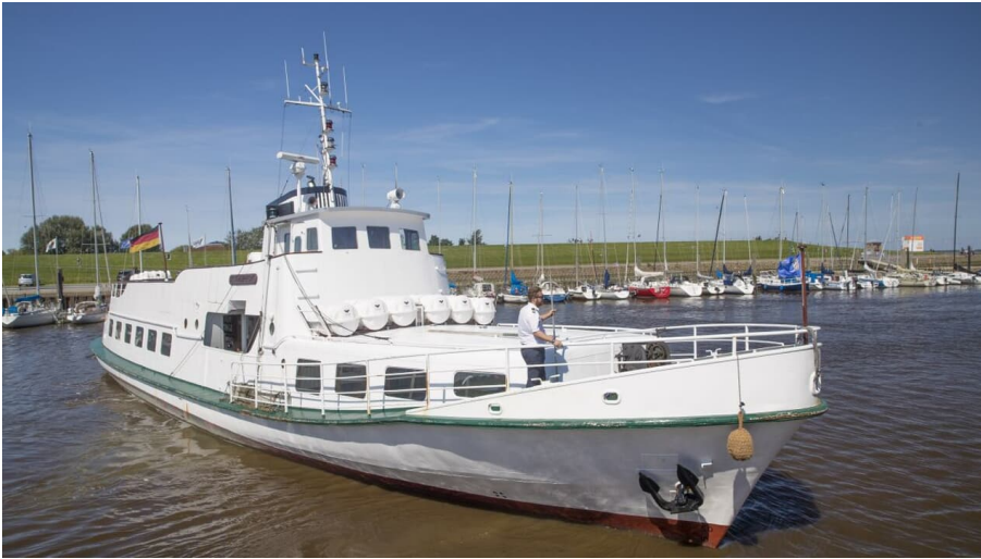
POI_Jens-Albrecht-Seetouristik 2.jpg