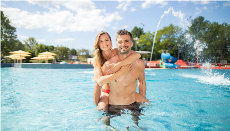
Freibad Angerbad in Ratingen