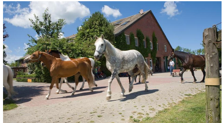
POI_Traberhof-Hooksiel.jpg - © Traberhof