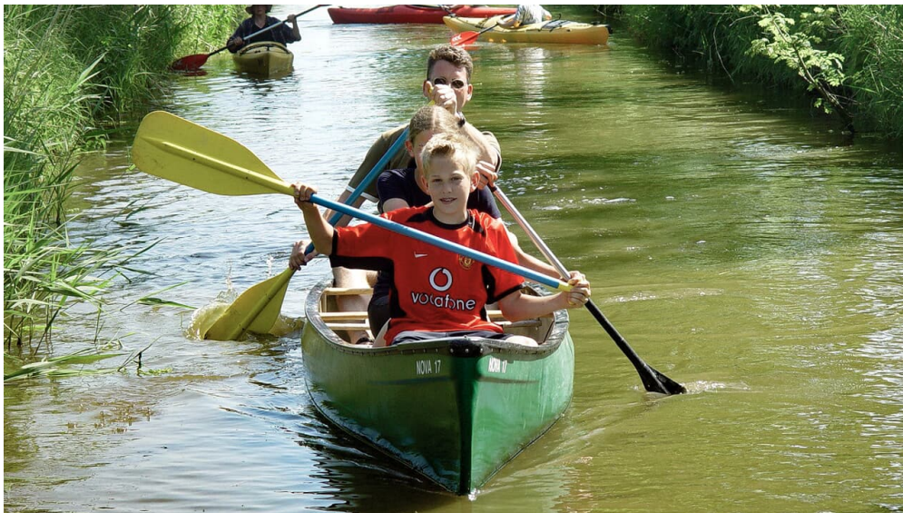
Grünes Kajak.png