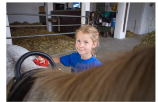
POI_Traberhof-Hooksiel.png - © Traberhof