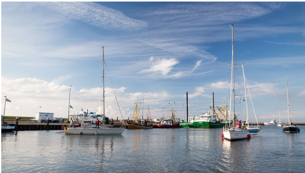
Wangerland 2016