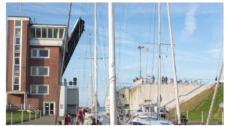
Wangerland 2016