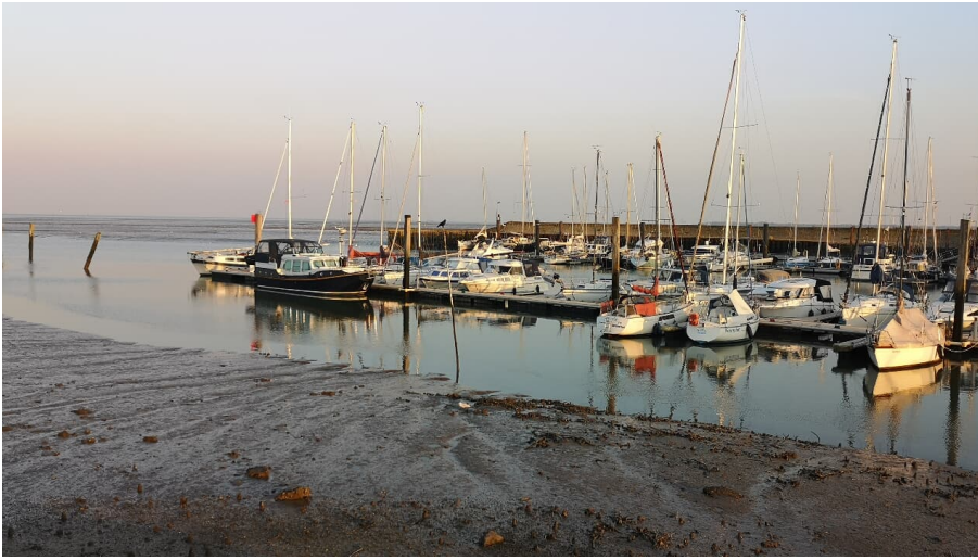
POI_Yachthafen_Horumersiel_WTG .jpg