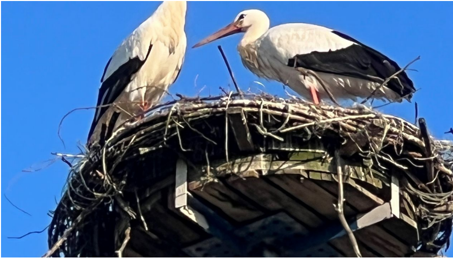
Stadt Petershagen_Storchenpaar auf Pfahlnest_blauer Himmel_hoch.jpg