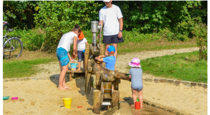
Wasserspielplatz am Erlebnispfad Holter Wald in Schloß Holte-Stukenbrock - © Teutoburger_Wald_Stadt_Schloss_Holte-Stukenbrock, Stadt Schloß Holte-Stukenbrock