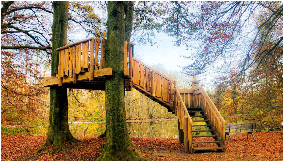
Beobachtungsplattform im herbstlichen Erlebnispfad Holter Wald in Schloß Holte-Stukenbrock