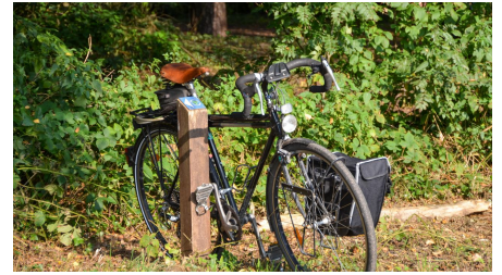
Fahrrad am Erlebnispfad in Schloß Holte-Stukenbrock