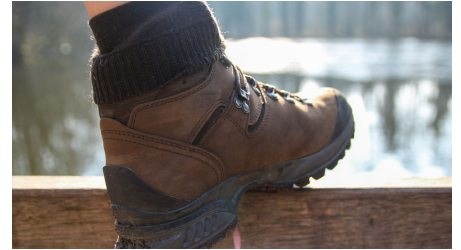
Wanderschuhe in Schloß Holte-Stukenbrock