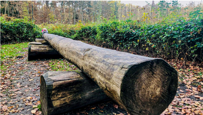
Baumtelefon am Erlebnispfad Holter Wald in Schloß Holte-Stukenbrock