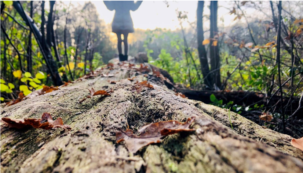
Erlebnispfad Holter Wald in Schloß Holte-Stukenbrock