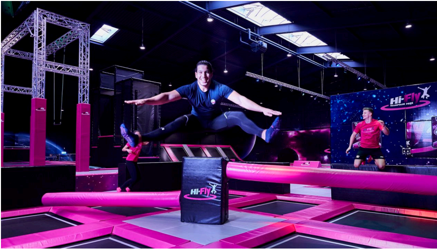
Hi-Fly Trampolin Park in Hilden