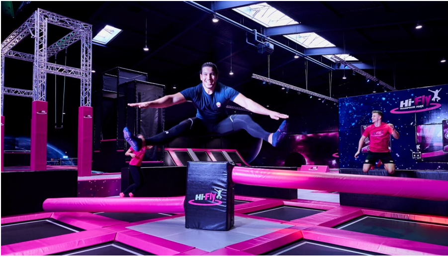
Hi-Fly Trampolin Park in Hilden