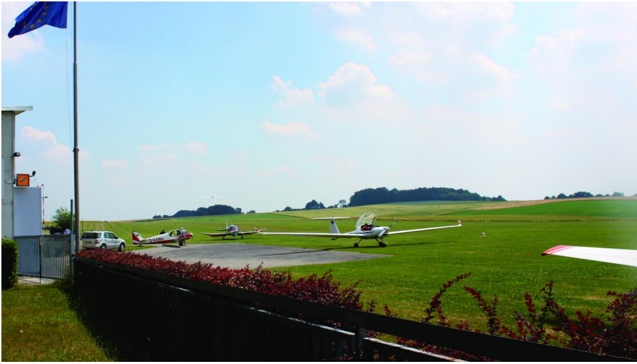
Segelflugplatz Meiersberg in Heiligenhaus - © Stadt Heiligenhaus, Stephan Nau