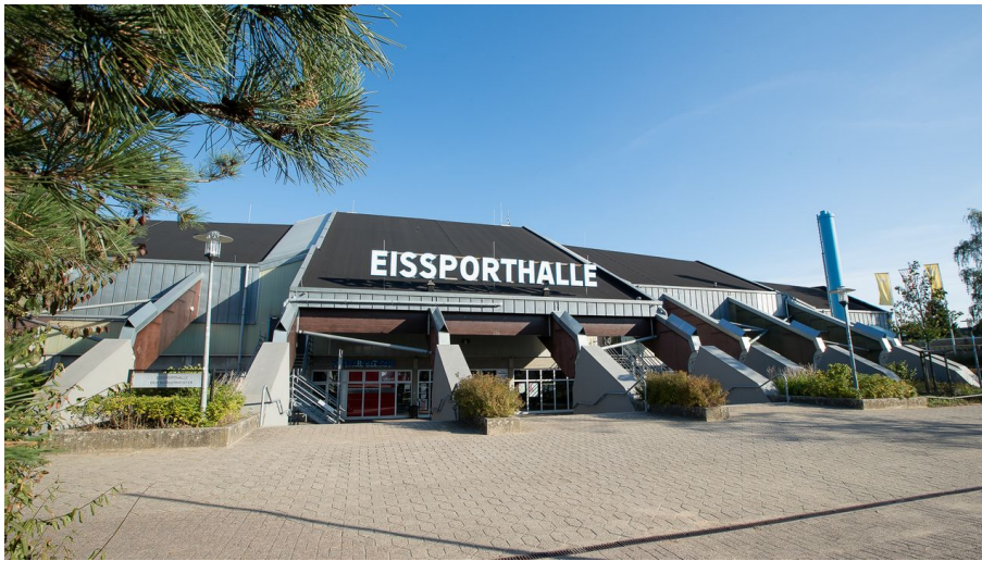
Eissporthalle Ratingen - © Maik Grabosch Creations, G. Bayer Eissporthalle