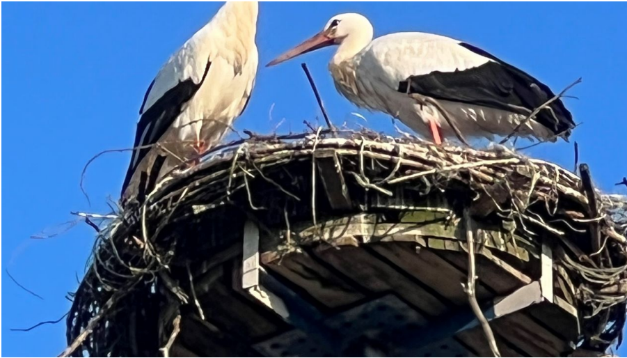
Stadt Petershagen_Storchenpaar auf Pfahlnest_blauer Himmel_hoch.jpg