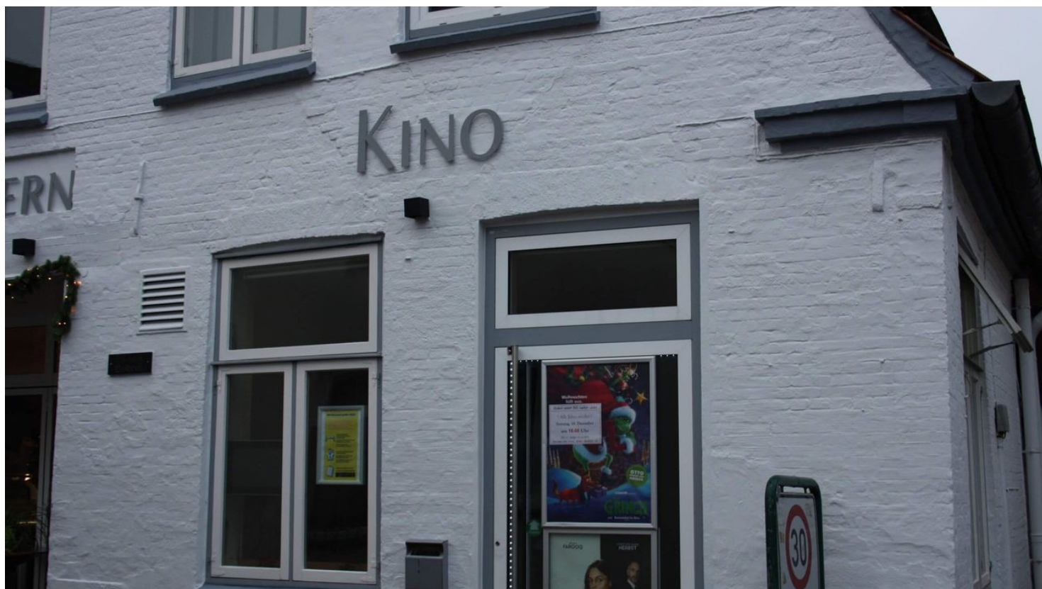
Kino Deutsches Haus

Die Öffnungszeiten passen sich dem Programm des Kinos an. Bitte rufen Sie sich auf der Website das Programm auf.