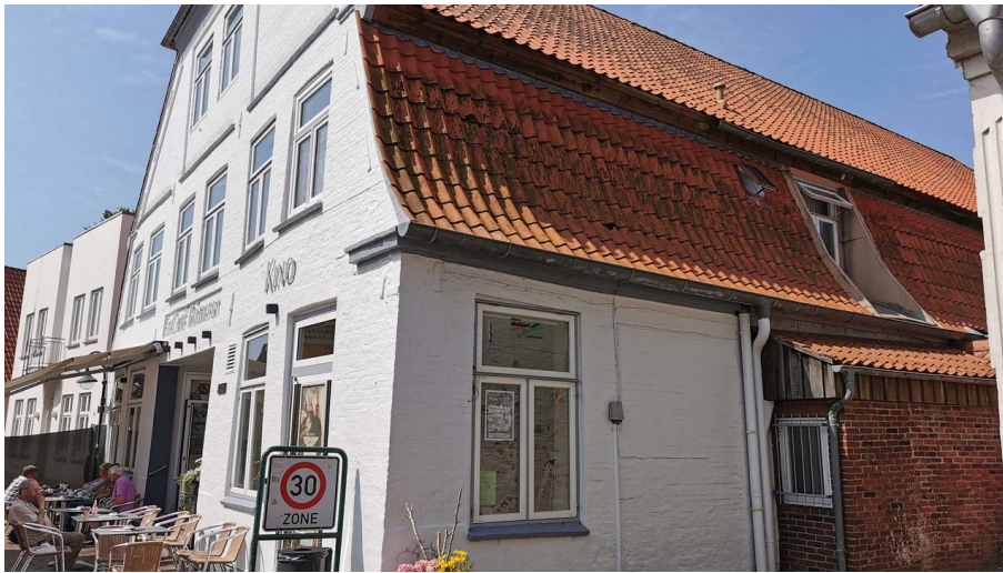
Kino Deutsches Haus