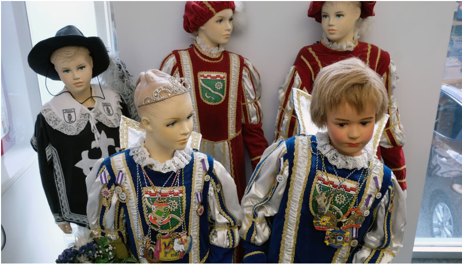
Rheinisches Karnevalsmuseum