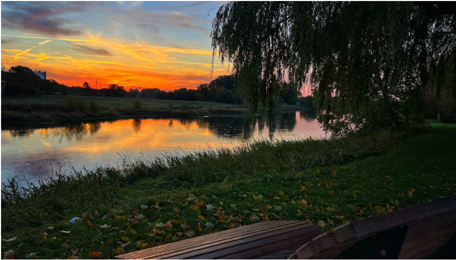
Stadt Petershagen_Petershagen_Sonnenaufgang_Herbst_Ösperhafen_Himmelsliege_Blick über Weser.jpg