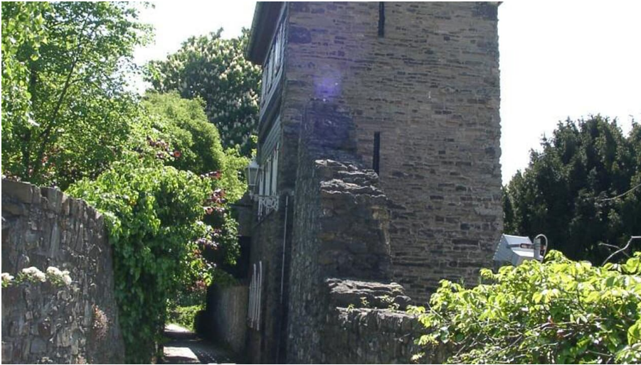
Trinsenturm in Ratingen