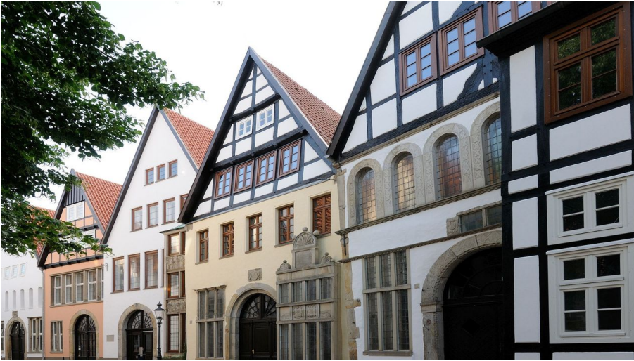
Minden Museumszeile Vorderansicht