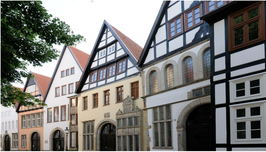
Minden Museumszeile Vorderansicht