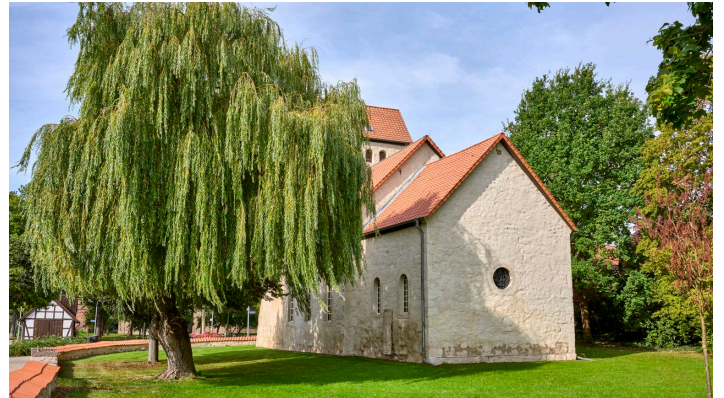
Sankt Georg Kirche Wendessen - © Anna Meurer