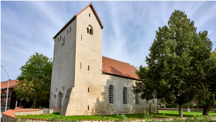
Sankt Georg Kirche Wendessen