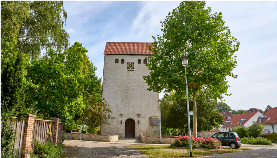
Sankt Georg Kirche Wendessen