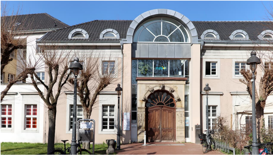
stadtbibliothek.jpg