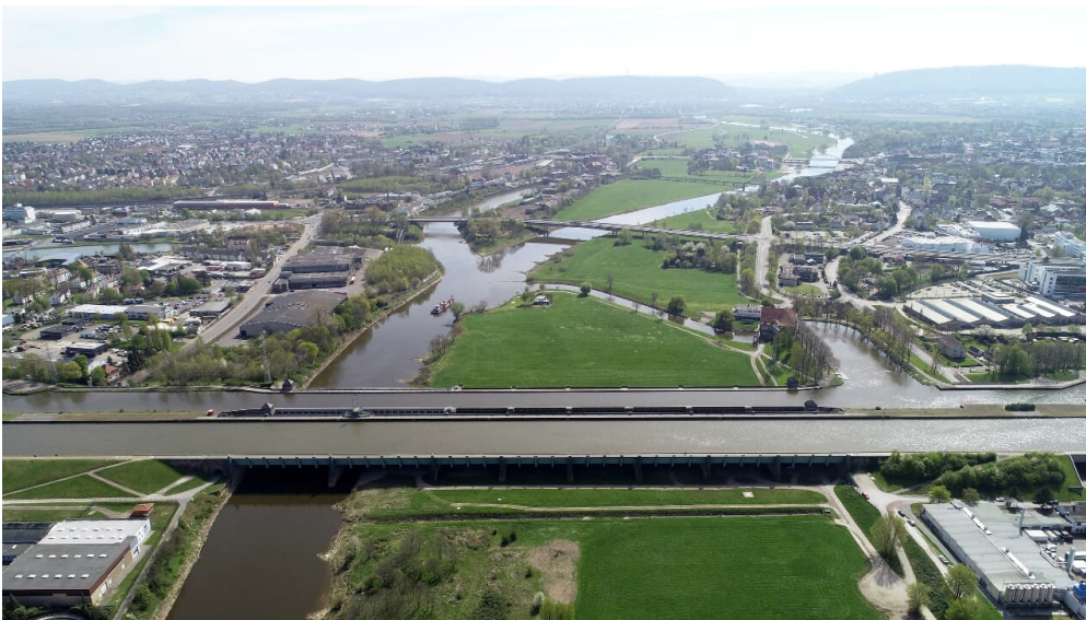
wasserstrassenkreuz_1.JPG