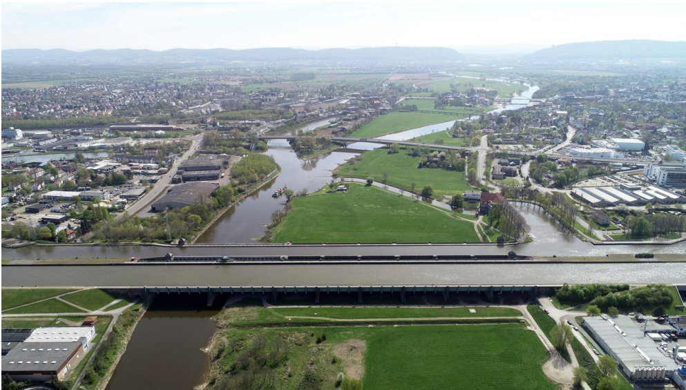
wasserstrassenkreuz_1.JPG