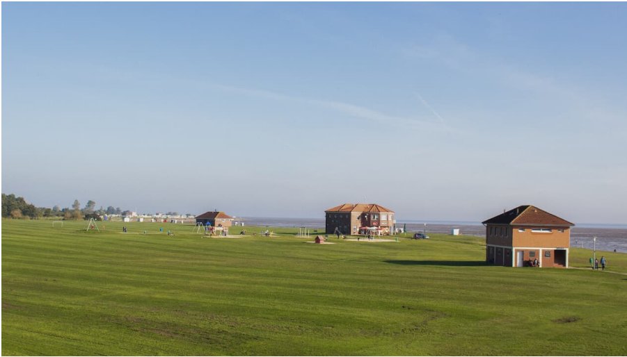
POI_Horumersiel Strand_WTG.png