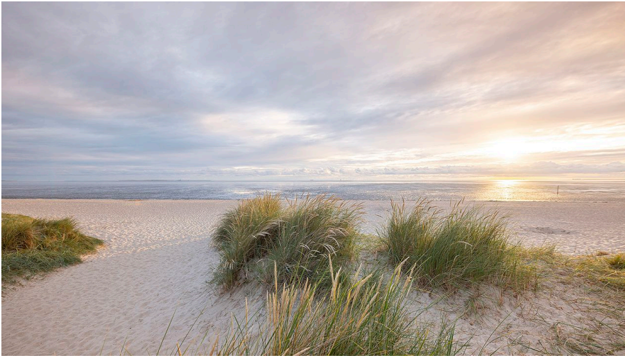
Strand-Schillig-Oliver Franke.jpg - © Oliver Franke