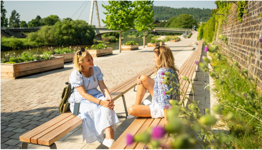
Hoexter-Weserufer-Stadt Hoexter-D. Ketz-2023-282.jpg - - info@hoexter-tourismus.de