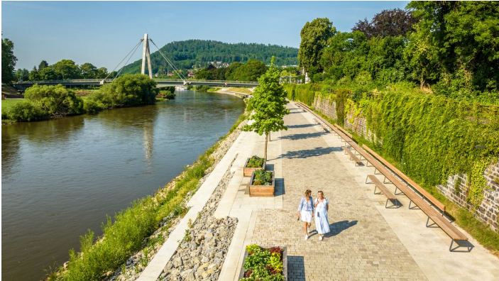
Hoexter-Weserufer-Stadt Hoexter-D. Ketz-2023-270.jpg

Die Landesgartenschau 2023 in Höxter ist von April bis Oktober täglich von 9.00 - 19.00 Uhr für den Einlass geöffnet. Das Gelände muss bei Einbruch der Dämmerung, spätestens jedoch um 21.00 Uhr über die Ausgänge verlassen werden.