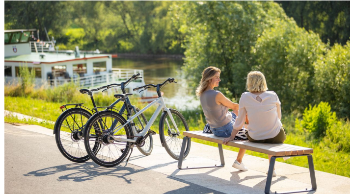
Hoexter-Weserradweg-Stadt Hoexter-D. Ketz-2023-248.jpg - - info@hoexter-tourismus.de