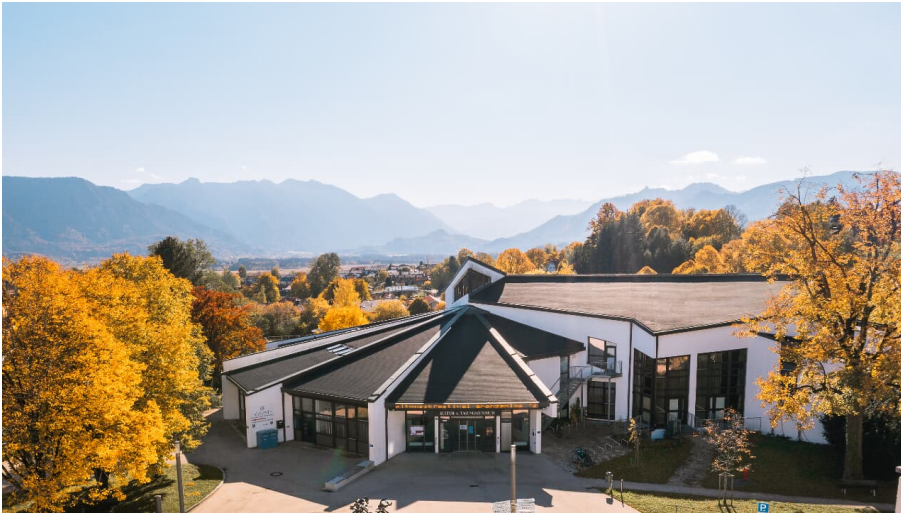
KTM von oben @Tourist-Info.jpg