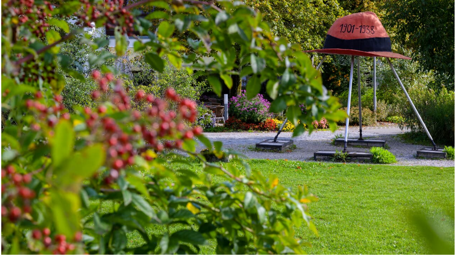
Kulturpark_Horvaath Hut (5).jpg