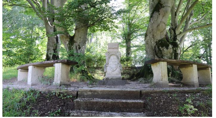
Seidlpark 2 @Carolina Hopen.JPG