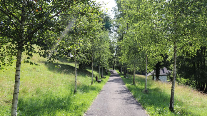
Seidlpark 6 @Carolina Hopen.JPG