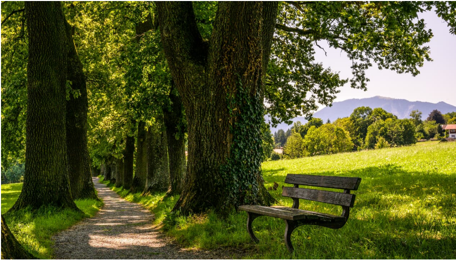
Kottmüller Allee_Sommer@thomas Rychly.jpg