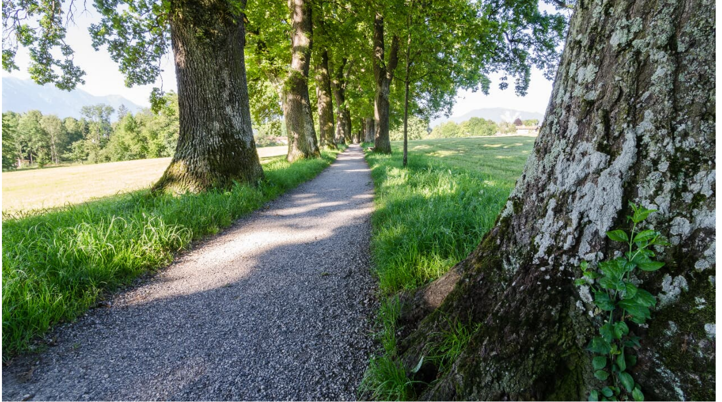
Kottmüllerallee @Simon BAuer.jpg