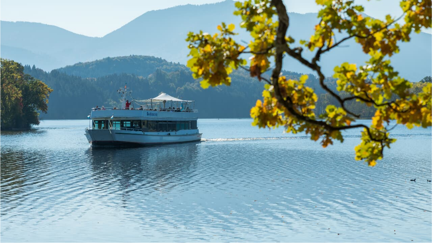
Schiffahrt auf dem Staffelsee.jpg