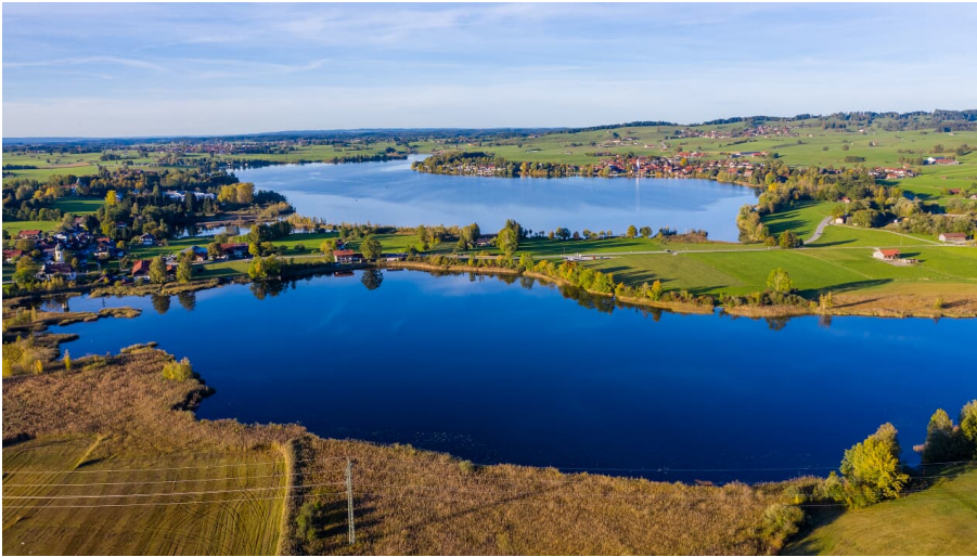
Froschhauser See mit Riegsee (4).jpg