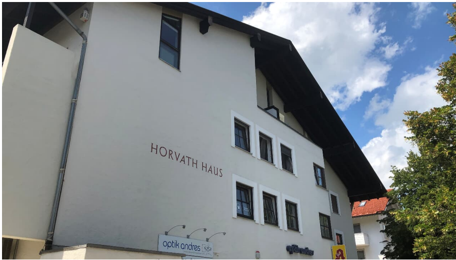
Horváthhaus 3.JPG