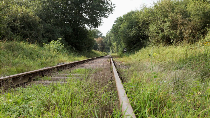
Schiene CC BY-SA - LTM.jpg