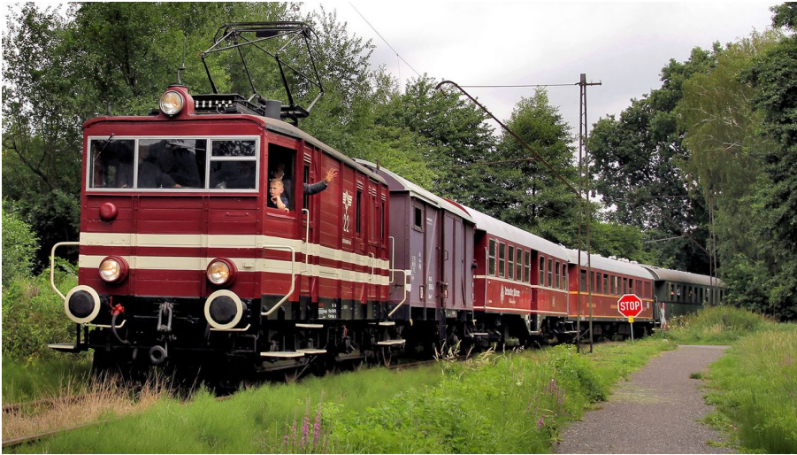
Museumseisenbahn