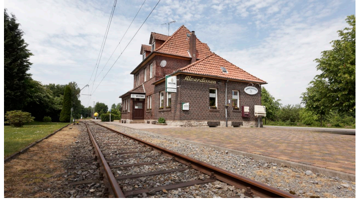
Bahnhof Alverdissen