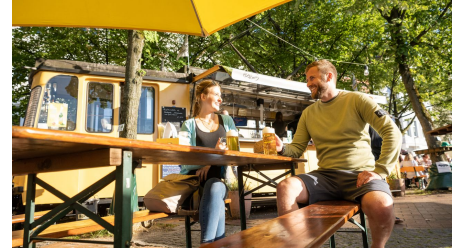
Bielefeld-Siegfriedplatz (Sigg)-Teutoburger-Wald-Tourismus-D-Ketz-090.jpg