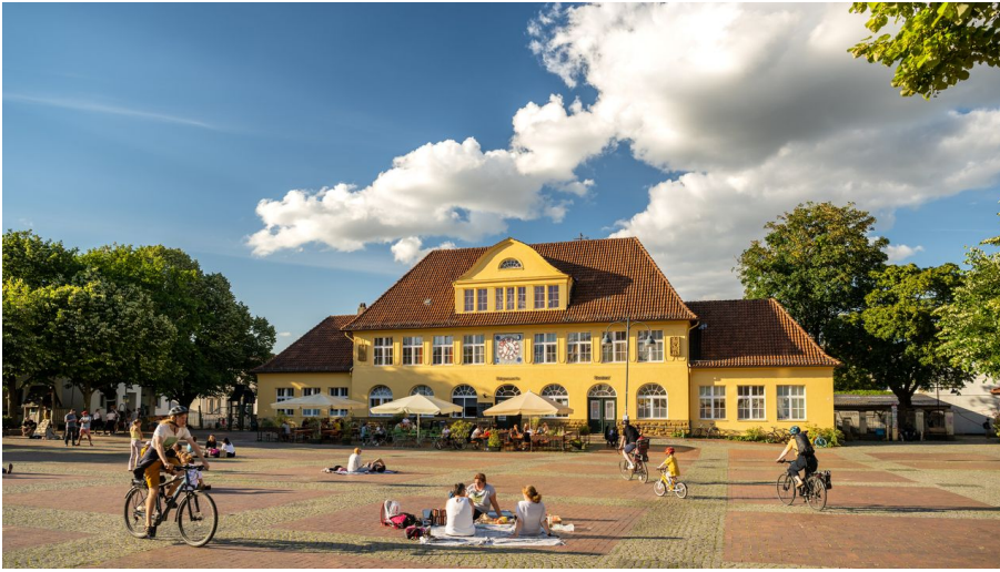
Bielefeld-Siegfriedplatz (Siggi)-Teutoburger-Wald-Tourismus-D-Ketz-087.jpg