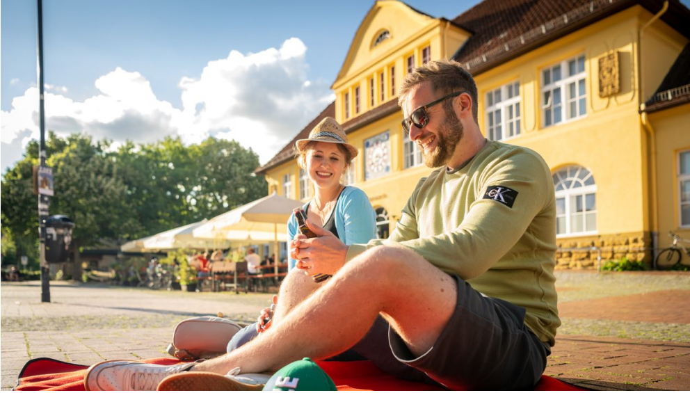
Bielefeld-Siegfriedplatz (Sigg)-Teutoburger-Wald-Tourismus-D-Ketz-082.jpg