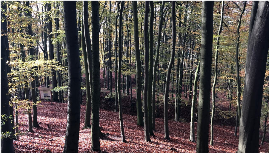
Wallanlage Alt-Sternberg